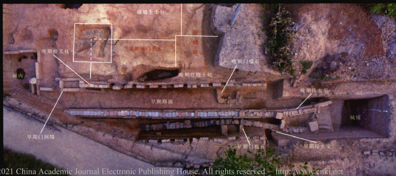
图 4 西城门